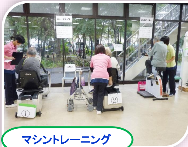
マシントレーニング