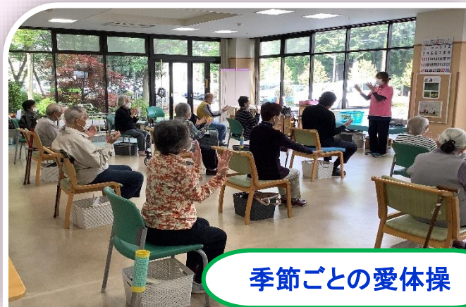
季節ごとの愛体操