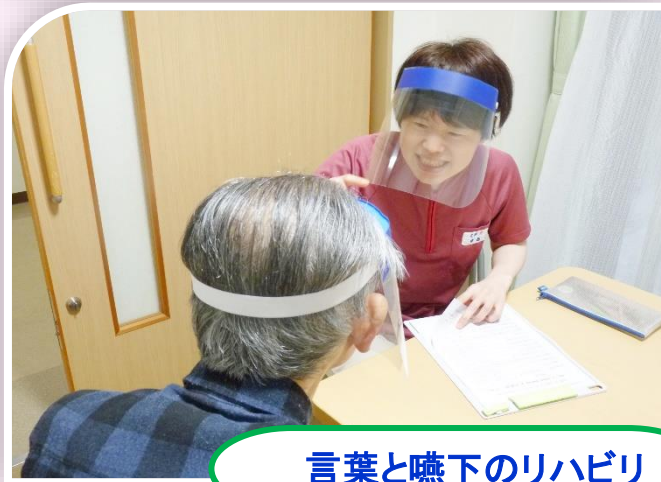
言葉と嚥下のリハビリ